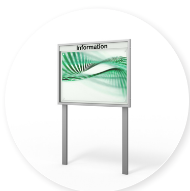
Optional: freistehende Variante auf Standbeinen